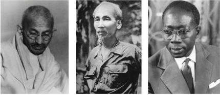
Gandhi Hô Chi Minh Senghor 3 grandes figures de l'indépendance

1 er mouvement de décolonisation (1947-1962)