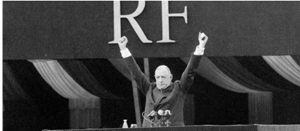
De Gaulle présente la Vème République

Vème république, De Gaulle au pouvoir (1958-1969) Politique de « grandeur nationale »