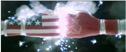
Rocky IV : Rocky Balboa vs Ivan Drago