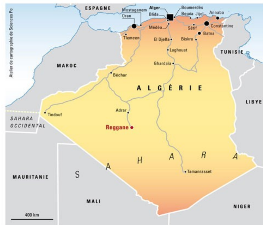
Doc 3 : Reggane, Sud du Sahara algérien, à 1800 km d'Alger

Doc 2 : Reggane... Le Centre Saharien d'Expérimentations Militaires (CSEM) situé dans la région de Reggane fut le lieu des premiers essais des bombes atomiques françaises à partir du 13 février 1960. Le polygone de tir était situé à 50 km, au sud-ouest, à Hamoudia ; 4 essais y ont officiellement eu lieu dont le premier, « Gerboise bleue », atteignit 70 kT soit 3 fois la puissance de la bombe d'Hiroshima.