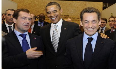
D. Medvedev, B. Obama, N. Sarkozy

2009 : la France réintègre le Commandement de l'OTAN sous La présidence de Nicolas Sarkozy