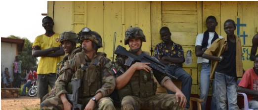
opération Sangaris en Centrafrique

2013 : intervention de la France au Mali 2014 : intervention de la France en Centrafrique « devoir d'assistance et de solidarité » dans Le cadre de résolutions de l'ONU