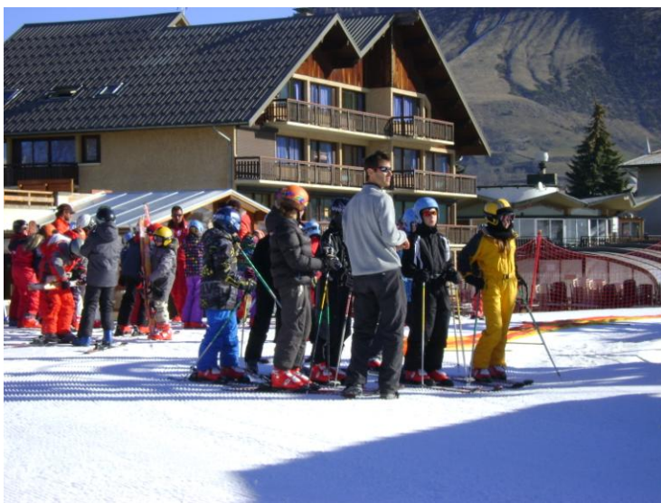
Les niveaux « première étoile » sont partis, bâtons à la main sur les remontées...