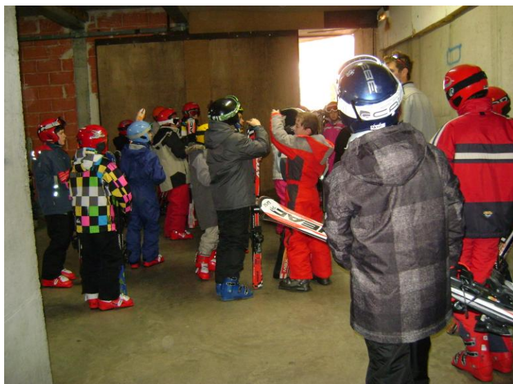
Sortie du chalet avec les skis

Ils ont ainsi tous pu partir sur les pistes à la rencontre de leurs moniteurs.