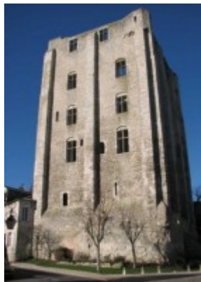
La tour César