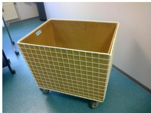
Notre bac à papier