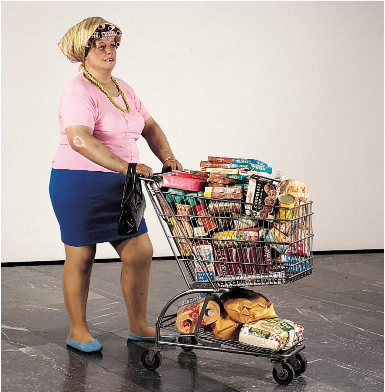
Duane Hanson – Supermarket Lady- 1969-1970 – Musée de Budapest, Hongrie.