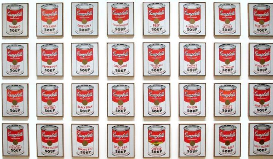
Campbell's soup cans- 1962 Peinture polymère sur toile- 51 x 41 cm par toile- MOMA de New York.

« Lorsque quelqu'un s'avise de mettre 50 boîtes de soupe Campbell sur une toile, ce n'est pas le point de vue optique qui nous préoccupe. Ce qui nous intéresse, c'est le concept qui fait mettre 50 boîtes de soupe Campbell sur une toile. » Marcel Duchamp.