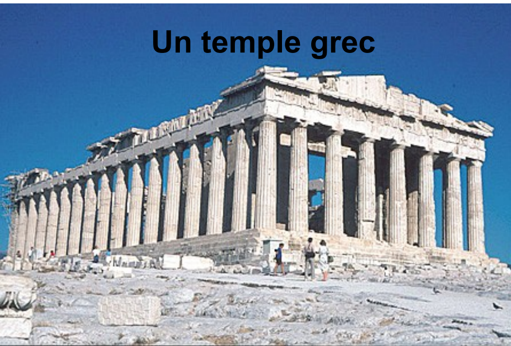
Un temple grec

L'art arabe est influencé par l'art grec et romain