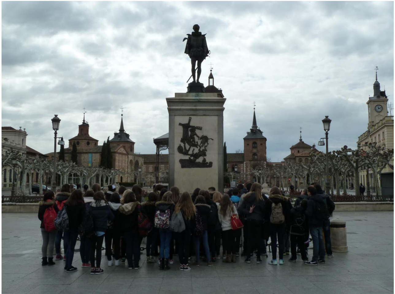
Dans la maison de Miguel de Cervantes