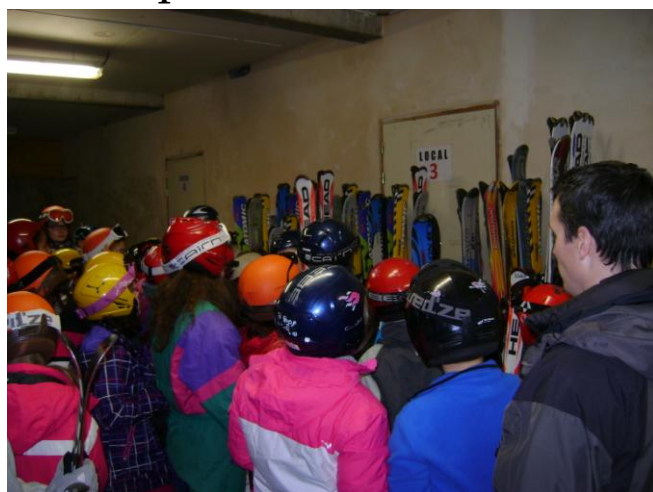
puis ils sont partis sur les pistes à la rencontre des moniteurs.

Il a ensuite fallu que chacun trouve ses skis,