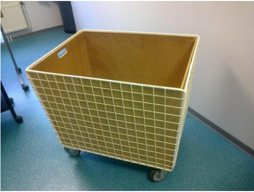
Notre bac à papier

Notre bac à papier est un prisme. Mais nous allons considérer que c'est un prisme droit avec les dimensions suivantes :