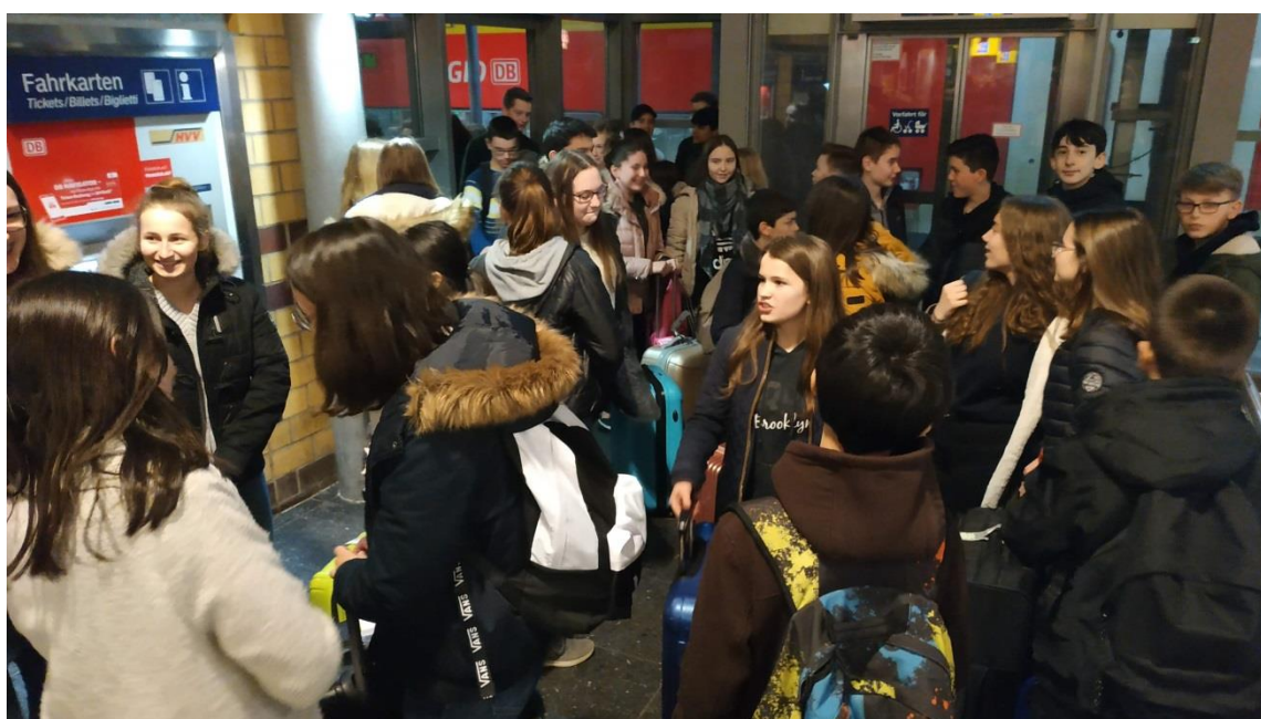
La rencontre avec les correspondants à la gare : entre excitation et anxiété...