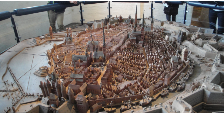
Maquette de la ville de Lübeck